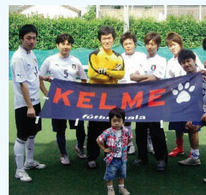
フットサルクラブ